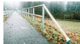
Absenkung Alternative 1