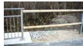
2 Rundhölzer mit Verbindung zum Geländer