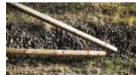
Absenkung Alternative 2